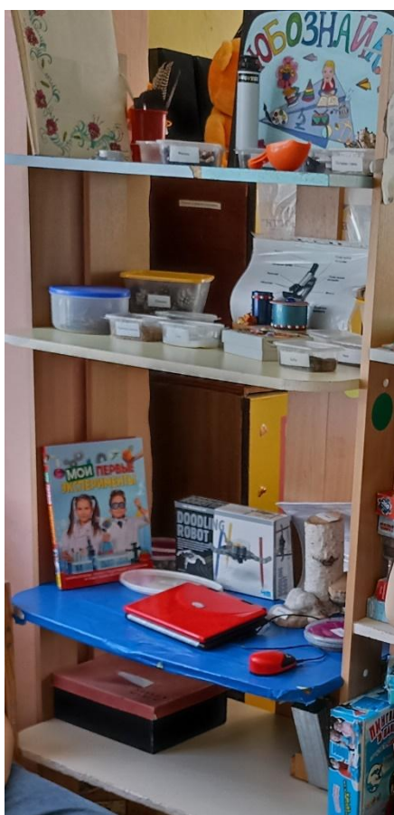
Центр «Математика и экономика»