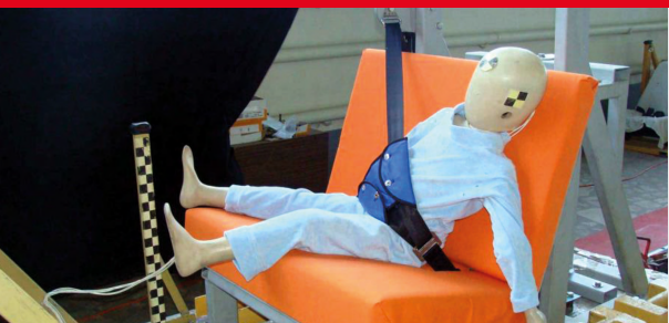
Результаты тестов использования небезопасных удерживающих устройств*

Дополнение определения «направляющая ляжка» в Правилах ЕЭК ООН № 44-04 было одобрено Всемирным Форумом (WP.29). Внесенная поправка к формулировке указывает на то, что «направляющая ляжка» рассматривается как составной элемент детской удерживающей системы и НЕ может отдельно официально утверждаться в качестве детской удерживающей системы в соответствии с настоящими Правилами». Это исключает даже формальную возможность сертификации устройств типа «направляющая ляжка»!