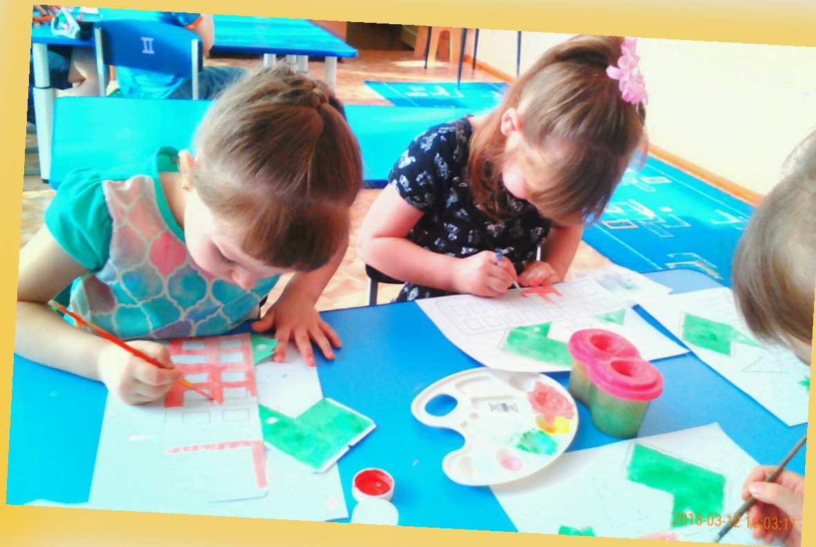
Раскрашивание макета здания