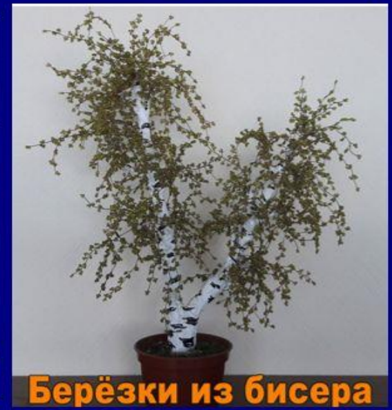
Берёзки из бисера