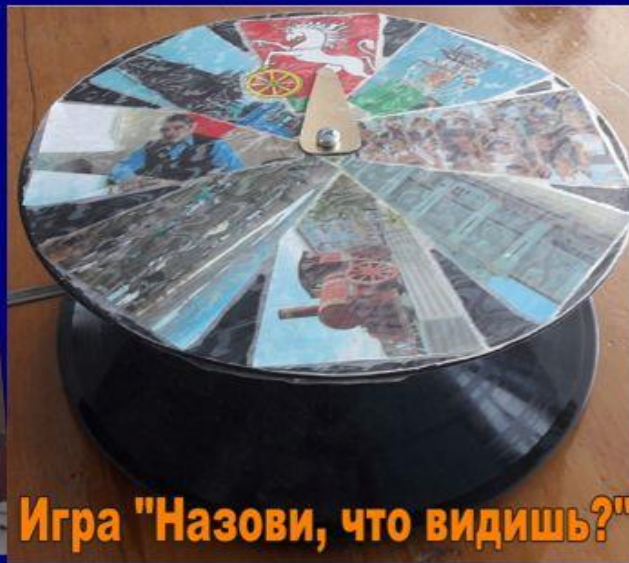
Игра "Назови, что видишь?"