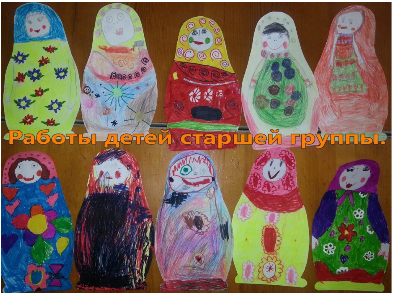
Работы детей старшей группы.