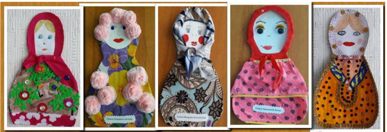
Детско - родительские работы.