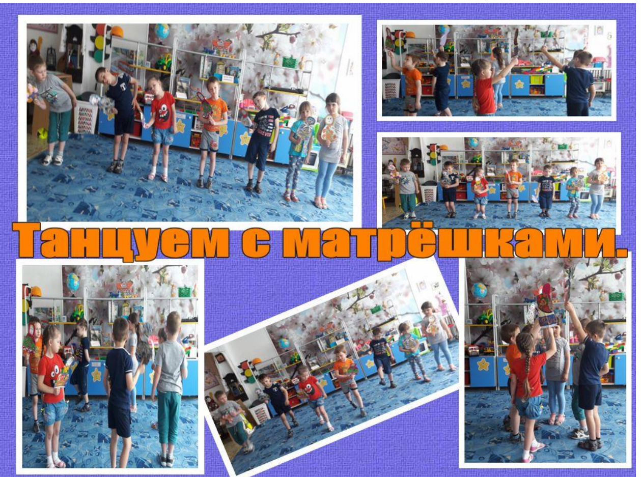
Танцуем с матрёшками.