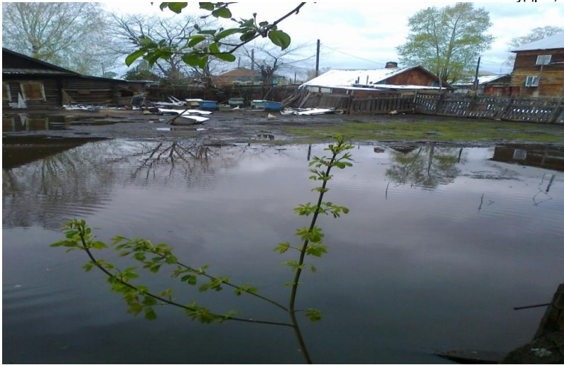
В огороде у соседей.