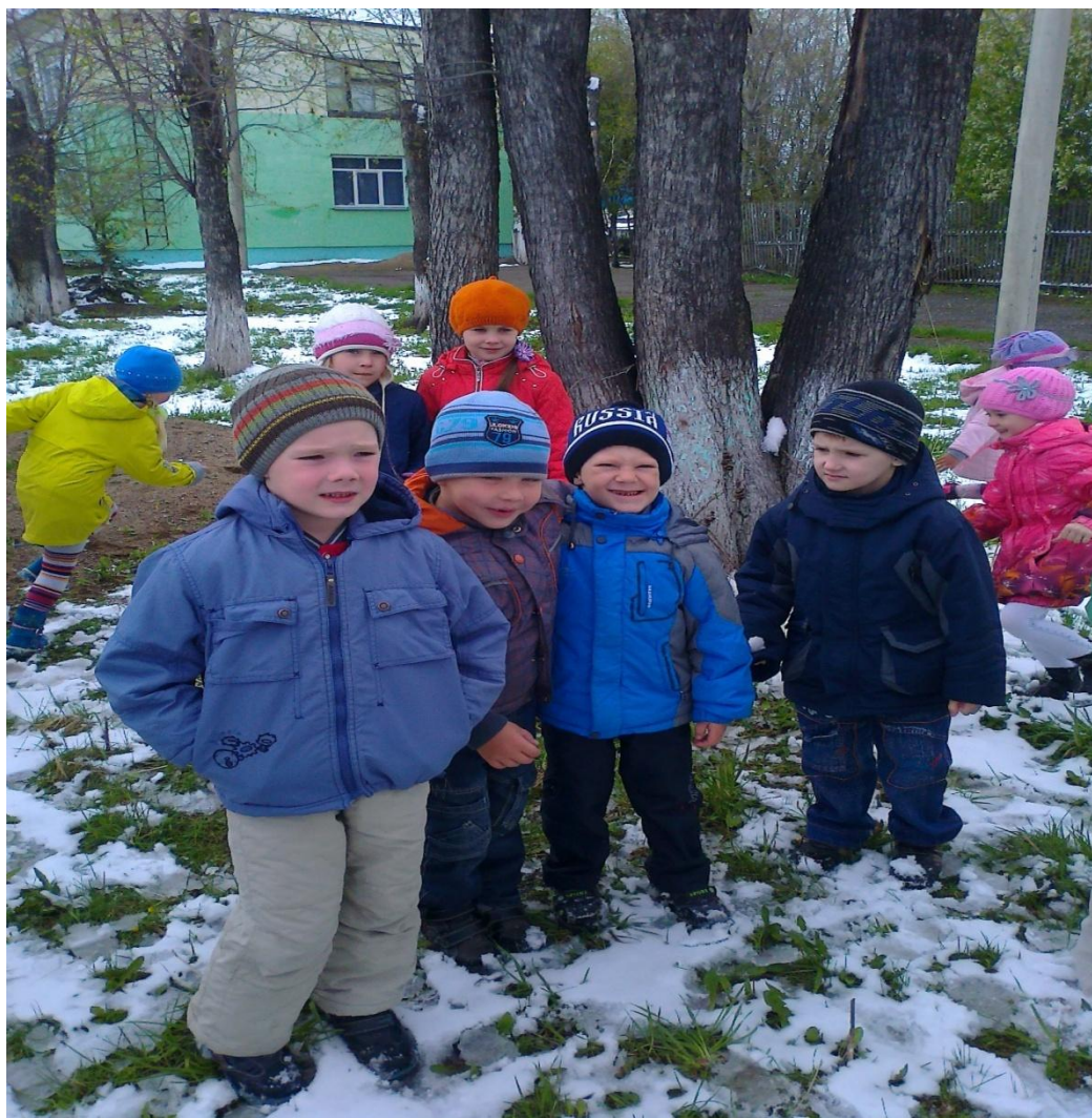
«Раз, два, три – к дереву беги»