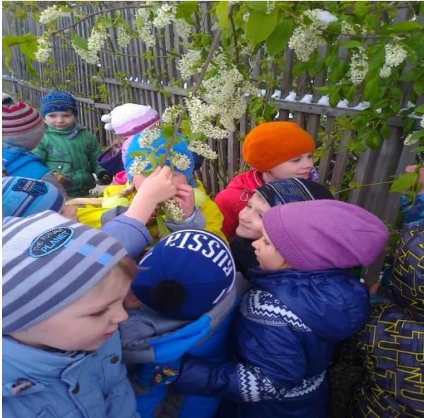
Черёмуха душистая С весной расцвела И ветки золотистые, Что кудри, завила.